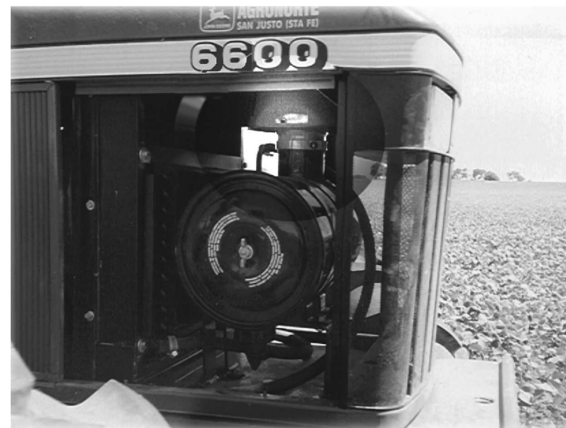
*LOS GRÁFICOS INDICAN LA POSICIÓN CORRECTA DEL PRE-FILTRO